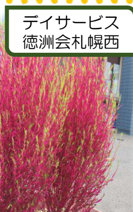
デイサービス 徳洲会札幌西

紅色があちこちを彩りました。 色が変わらないコキアや、 大きさ、形に個体差があり 「なんでかな？」との声が 聞こえてきました。 コキアが植えてある場所を コースに、お散歩をする方 もいらっしやいました。