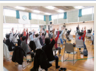
📍💬 札幌市西区介護予防センター西野 介護予防おしゃべりクラブ