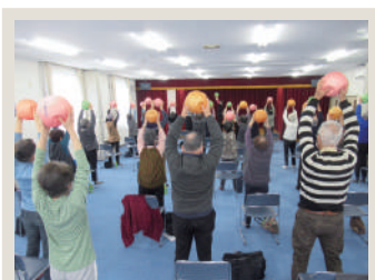
📍💬 札幌市西区介護予防センター西野 ガンバレ体操