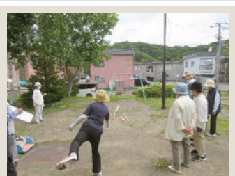
📍💬 札幌市西区介護予防センター西野 地域サロンモルック