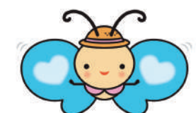
札幌市介護予防センター イメージキャラクター かよるん