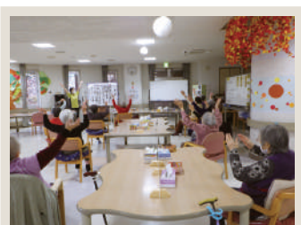
📍💬 五天山園デイサービスセンター みんな体操