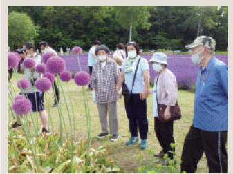
📍💬 デイサービス五天山ふれあ 幌見峠ラベンダー園見学