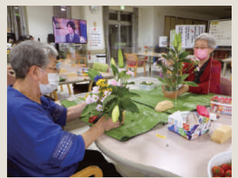
📍💬 五天山園デイサービスセンター フラワーアレンジメント