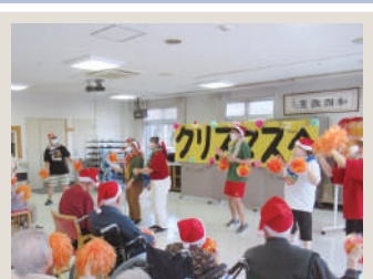
📍💬 特別養護老人ホーム五天山園 クリスマス会