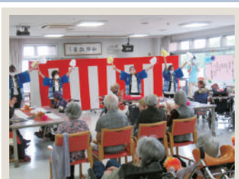
📍💬 特別養護老人ホーム五天山園 敬老会