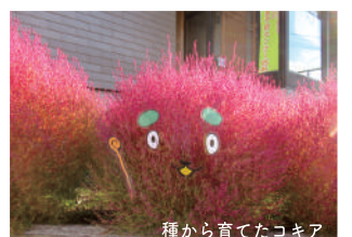
種から育てたココア