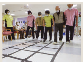
📍💬 五天山園デイサービスセンター ふたねと運動