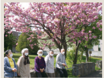
📍💬 デイサービス五天山ふれあ お花見散歩